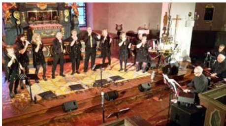
Konsert i Grangärde kyrka feb. 2017

Du som gillar gospel och tycker om att sjunga är välkommen att vara med. Vi kommer att sjunga 4-5 låtar tillsammans med In Connection som sen står för resten av programmet.