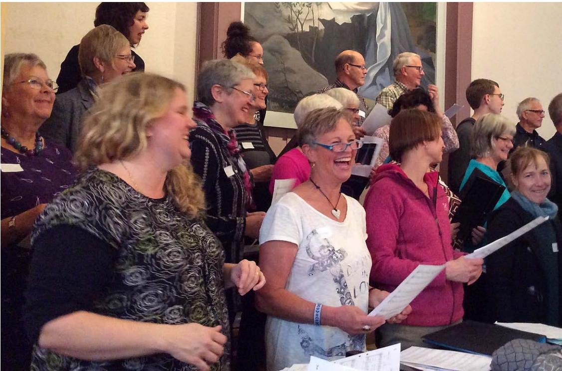
En intensiv körhelg gav ny energi.