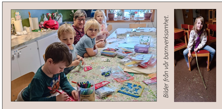
Bilder från vår barnverksamhet.