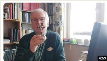
Tankar för veckan, 10 2023