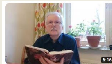
Tankar för Veckan, 12 2023

Jesus är vår enda lärare! Matt 23:10. Lär dig av honom. Hela sammanhanget står i Matt 23:1-39