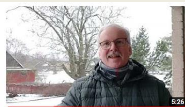
Tankar för veckan, 08 2023