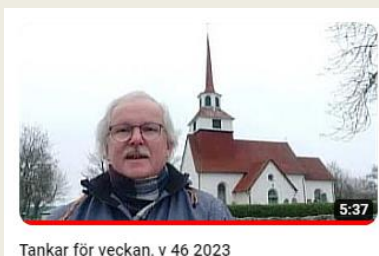
Tankar för veckan, v 46 2023