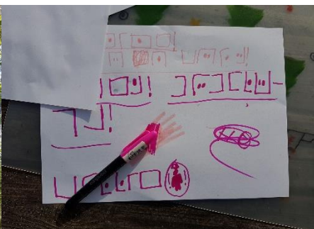
Bilder från scouterna under 2020