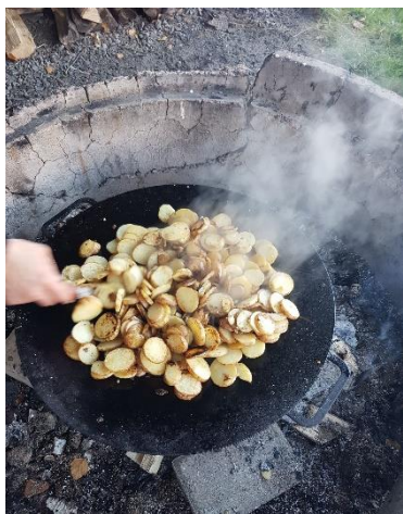
Bilder från scouterna under 2020

Det blir julsång, frågetävling, samtal kring mission, samtal med gäster som arbetat i kyrkor i andra länder, andakt, insamling till vårt arbete med kyrkor i andra länder och en del annat.