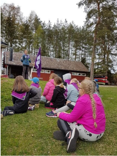
Bilder från scouterna under 2020