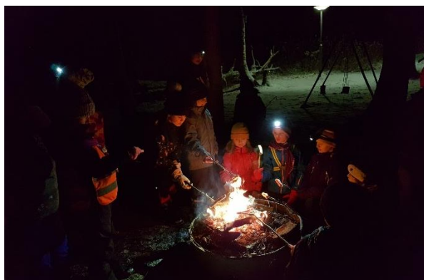
Bilder från scouterna under 2020

Equmenia Skårekyrkan har sitt årsmöte 6/3. Tid och mer info kommer längre fram!