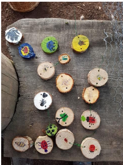
Bilder från scouterna under 2020

För den som vill så är Vägsjöfors fortfarande öppet, den som vill kan boka Bed and Breakfast!