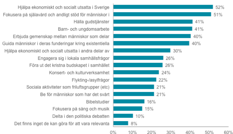
Figur 1. "Vad tycker du att svenska kyrkor och församlingar bör ägna sig åt för att fylla en relevant funktion i dagens samhälle?" Flera svarsalternativ möjliga.

Mer anmärkningsvärt än att människor knyter hjälp till utsatta till relevans är kanske att nästan lika många, runt 40 % av de svarande, anser att gudstjänster är en väg till ökad relevans, trots att relativt få själva deltar i en gudstjänst mer regelbundet. 74% av respondenterna gör det mer sällan än en gång per år.