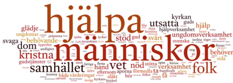
Figur 3. Ordmoln baserat på den öppna frågan "Vad anser du att kyrkor och samfund framförallt bör inrikta sin verksamhet på, för att de ska fylla en relevant funktion i dagens samhälle?"