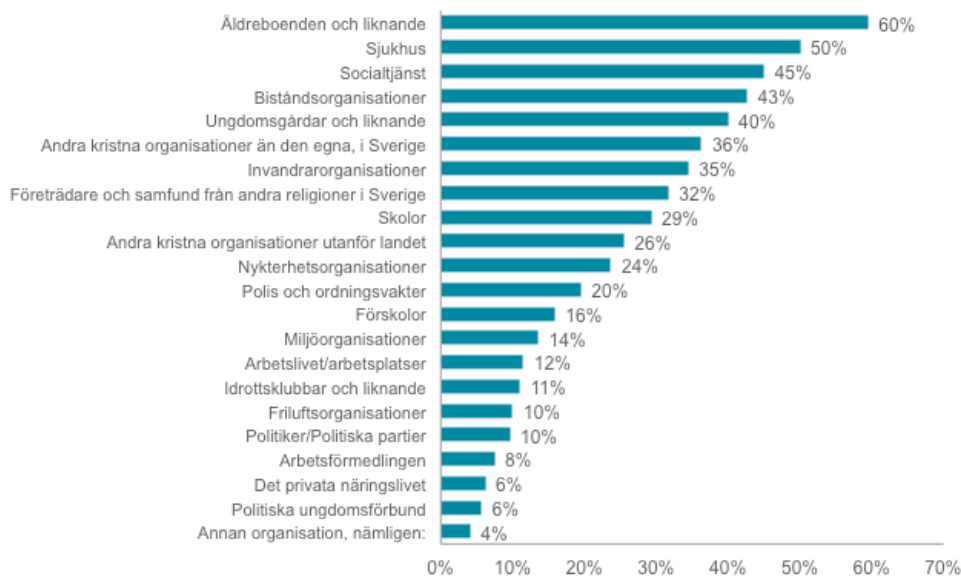
Figur 2. "Vilka organisationer bör svenska kyrkor och församlingar i Sverige samarbeta mer med?" Flera svarsalternativ möjliga.

På frågan om vilka kyrkor och församlingar borde samarbeta med anser svenskarna att det i första hand borde vara äldreboende (60%), sjukhus (50%) och socialtjänst (45%), följt av biståndsorganisationer (43%) och ungdomsgårdar (40%) (Figur 2). Även andra kristna organisationer (36%), invandrarorganisationer (5%) och företrädare för andra trosriktningar (32%) ses som viktiga samarbetspartners. Betydligt färre ser arbetslivet eller politiska organisationer och ungdomsförbund som naturliga samarbetspartners.