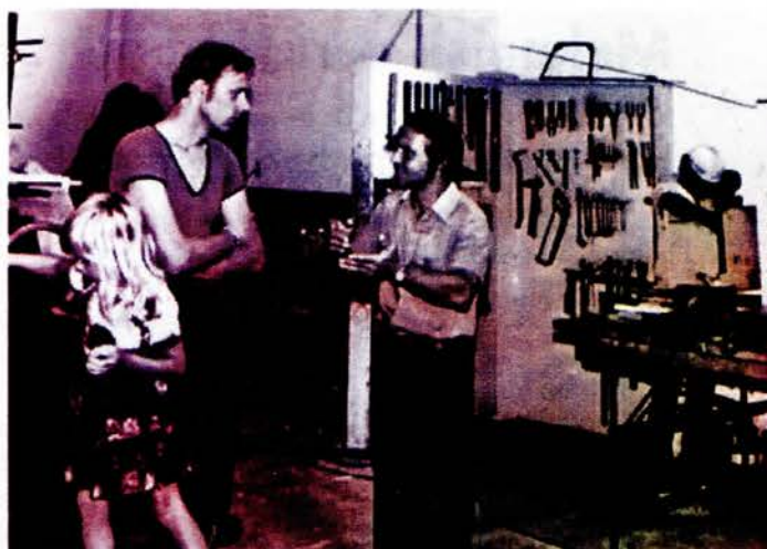
Instruktion på verkstadsgolvet, 1970-tal.

Verkstaden hade uppnått oväntat mycket av det man drömde om runt 1970: