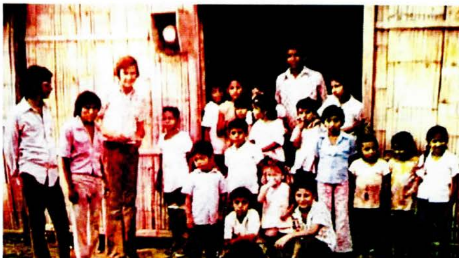
Söndagsskola i Ecuador.

De nya missionärerna var, efter en månads introduktion i kultur och tänkesätt på plats i Ecuador, väl förberedda. Och ändå inte.