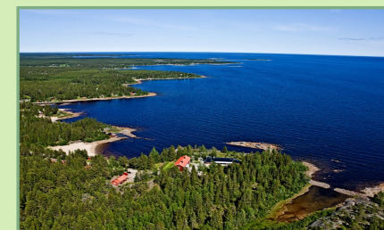
Munkvikens kurs och lägergård är belägen söder om Lövånger