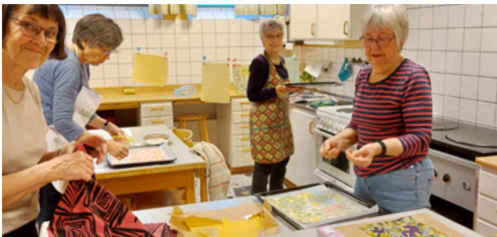
I Ansgarskyrkan i Västerås har man gjort egna bivaxdukar.

En stor utmaning vi har att tackla handlar om hur mycket plast vi omger oss med och använder. Dels tillverkas den största delen av all plast av olja, dels resulterar plast i stora mängder av mikroplaster som finns överallt i naturen och i våra egna kroppar. Ett bra sätt att minska sitt användande av plast – inte minst i en församling – är att minimera användandet av plastfolie och istället börja använda dukar av bivax! Det har man gjort i Ansgarskyrkan i Västerås! Så här såg det ut när de gjorde bivaxdukar. Gör ni hållbara inköp idag?