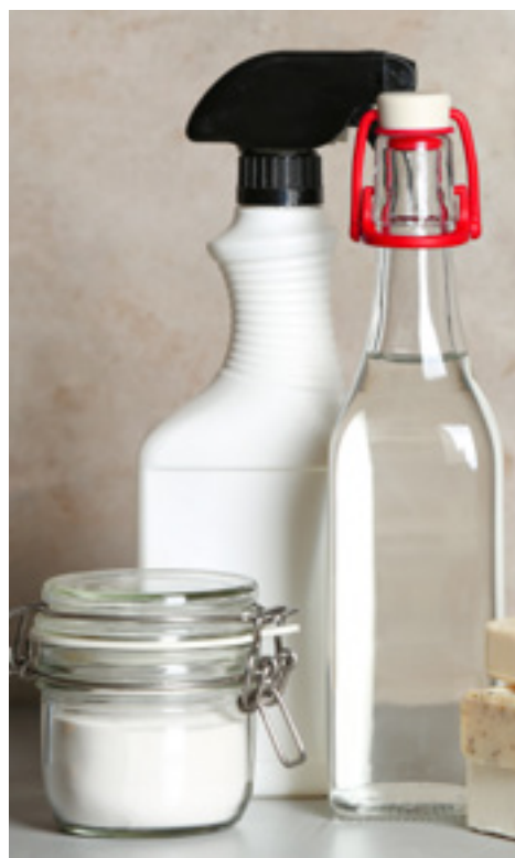
Nybrokyrkan i Falun gjorde om sina städrutiner och ersatte alla olika städmedel med ättika, bikarbonat och såpa.