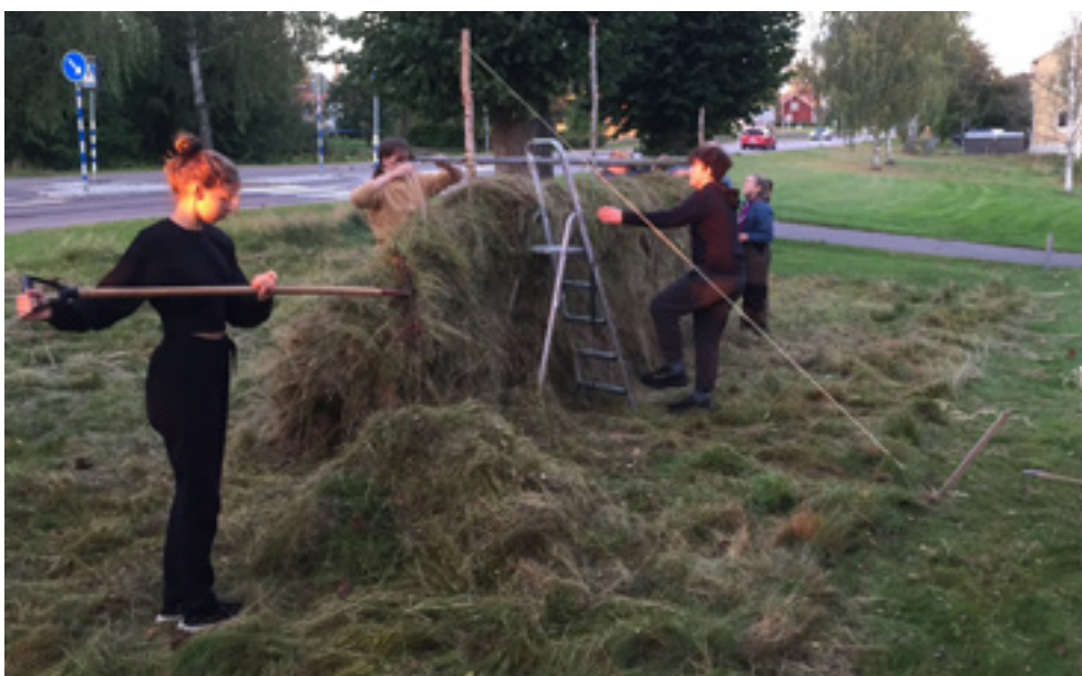
Sannerudskyrkan i Kil har anlagt en äng i stället för gräsmatta utanför sin kyrka

Våra kyrkobyggnader och fastigheter utgör en utmärkt resurs för oss att ställa om och bli skapelsevänliga. Men det gäller att vi förvaltar och utvecklar våra fastigheter på ett klokt sätt. Sannerudskyrkan i Kil har anlagt en äng i stället för gräsmatta utanför sin kyrka. Att skapa fler ängar är en viktig insats man kan göra för den biologiska mångfalden i ens absoluta närhet. Låt kyrkans gräsmatta bli en plats med större artrikedom! Ni kan komplettera ängen med insektshotell och att sätta upp en skylt för att inspirera fler i samhället att ta efter. Vad kan ni göra med er fastighet?