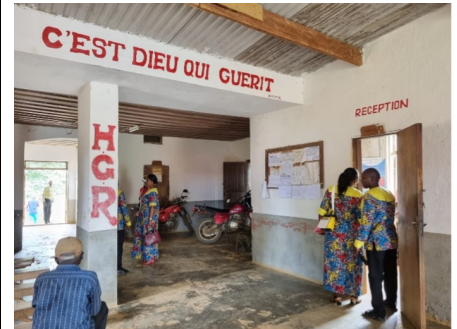
Reception och väntsal på sjukhuset i Kibunzi.