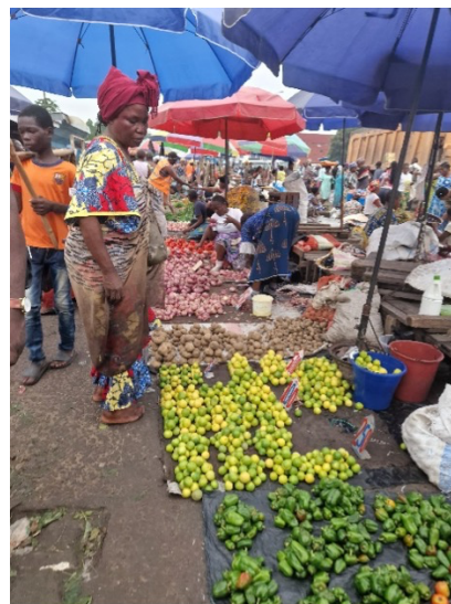
Marché total ligger precis utanför La Source, Brazzaville