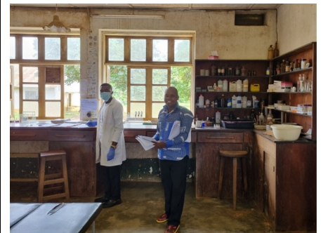
Sjukhusets laboratorium.