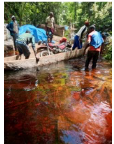
Svår framkomlighet mellan Ilope och Mimia.