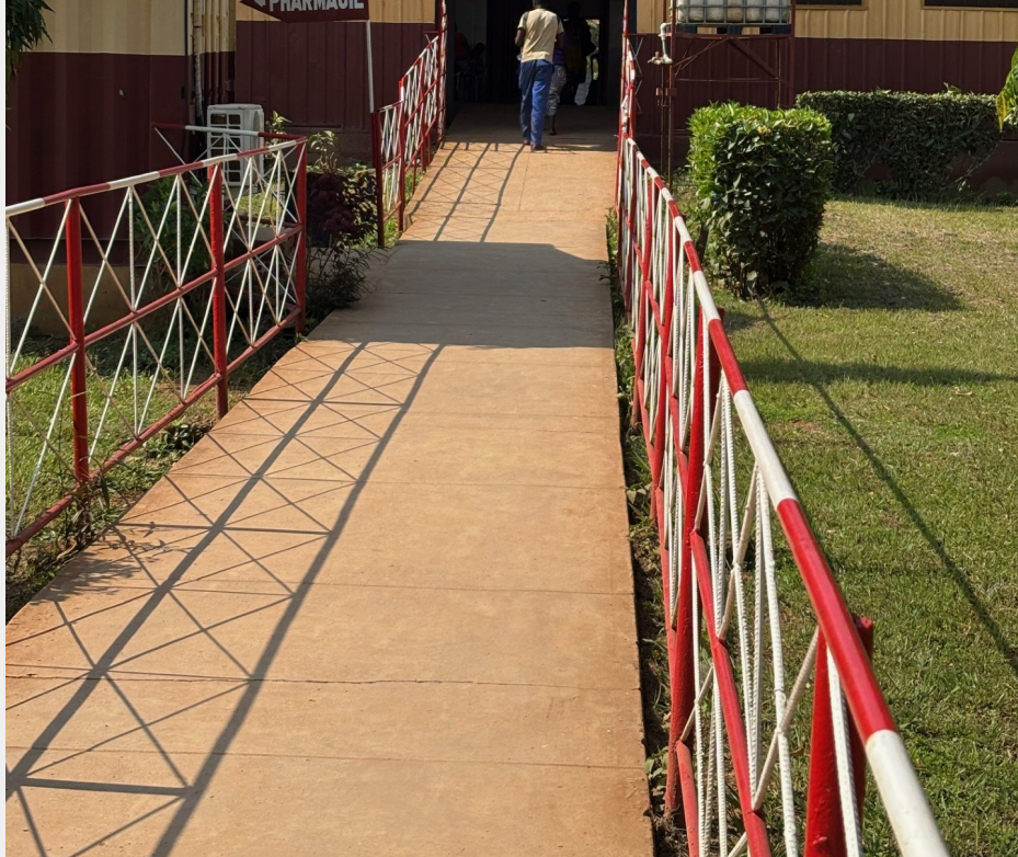
IME:s entré med texten Nzambi i zola - Gud är kärlek, över dörren.